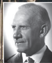
Sir Robert Robinson 1925