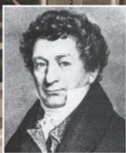
Friedrich Sertürner 1805